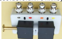
Адаптер подключения 1012 (1014)

* при установке переключателя в положения А или В - опции могут быть использованы с измерителями RLC и анализаторами компонентов WK в соответствии с нижеуказанной таблицей совместимости: