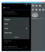
Виртуальное устройство Android