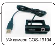
УФ камера COS-19104