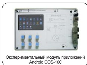
Экспериментальный модуль приложений Android COS-100