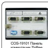
COS-19101 Панель коммутации ZigBee