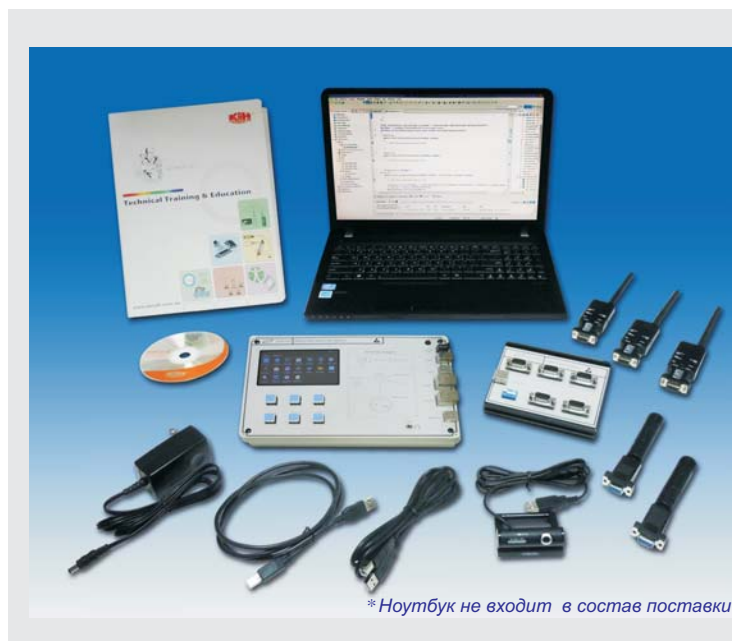
* Ноутбук не входит в состав поставки

Система Android, которая в основном используется для мобильных устройств, представляет собой ядро Linux операционной системы с открытым исходным кодом. Приложения Android, установленные в системе Android, называются Android-приложениями; их широко используют и активно разрабатывают. В COS-100 используются Android SDK (комплект для разработки приложений Android), JDK (инструментальный пакет для разработки Java-приложений) и Eclipse (интегрированная среда разработки), бесплатные и с открытым кодом.