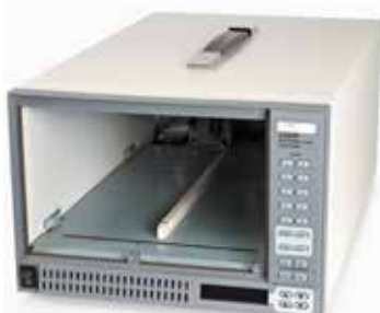
Шасси 3300F для 2-х модулей