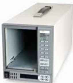
Шасси 3302F для 1 модуля электронной нагрузки

* Примечание: работе по интерфейсу GPIB используется только один адрес (листание/ Listen).