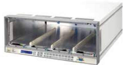
Шасси 3300F для установки до 4-х модулей электронных нагрузок