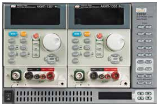
АКИП-1301 / АКИП-1303; с шасси 3305F